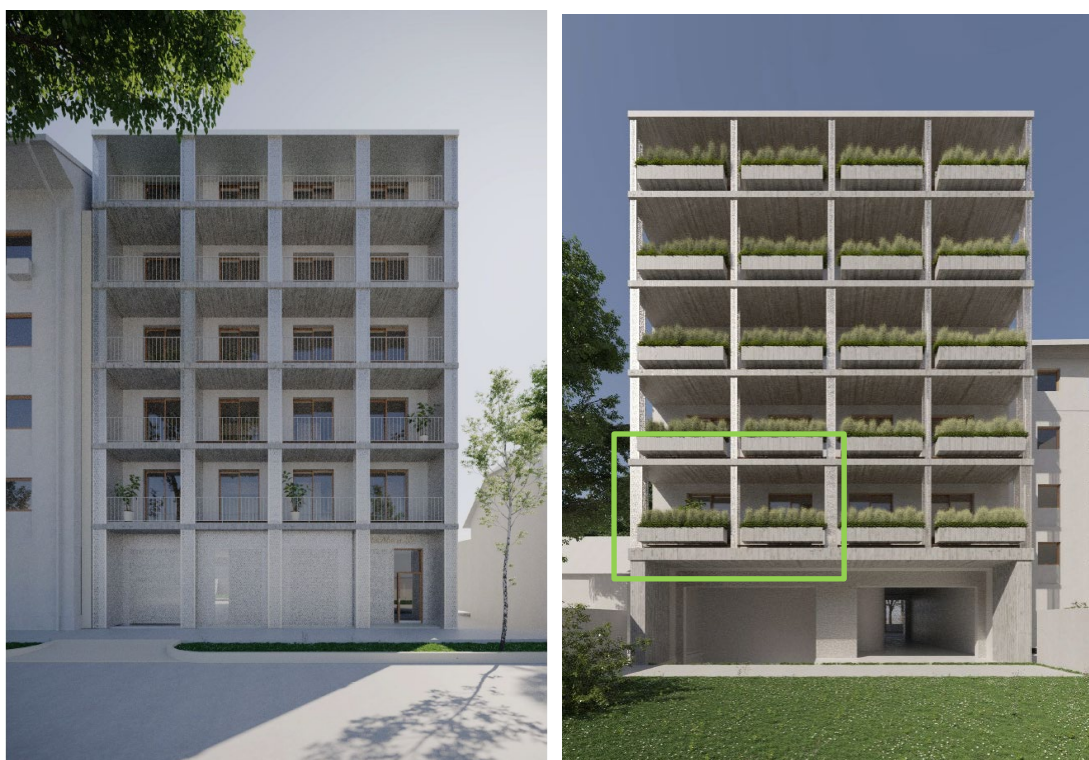
Utcai homlokzat (balra) és udvari homlokzat (jobbra), utóbbin a tárgy lakás pozíciója megjelölve.