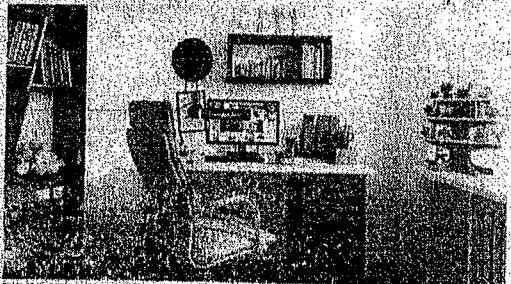
Akkor is a otthoni munkavégzésre kell áttérni.

tudniuk választani a munkavégzést a magánélettel; hiszen többen belesznek abba a hibába, hogy elkalandozik a figyelmük, és inkább a huzimunkával foglalkoznak. A otthon eddig csak otthon volt, de egy része most átalakult irodává, és így pl. a családnak is jelezni kell, hogy ha munkaidő van, ne zavarjanak.